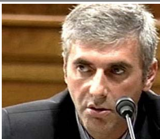
Взгляните: Леонид Невзлин – и Вы бы позволили этому человеку ухаживать за Вашей дочерью?

Полагают, что Московский арбитражный суд поддержит решение своих лондонских коллег. Сейчас синдикат западных банков под предводительством Societe Generale пытается забрать свои деньги у самого ЮКОСа. Аналогично голландская полиция помогает России заморозить активы, которые находятся в собственности МЕНАТЕПа посредством